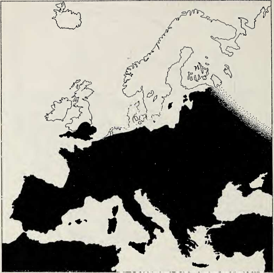
Abb. 2. Das Areal der Feldgrille, Gryllus campestris L.

Westfalen ist die Verteilung der Grillen ausgesprochen disjunkt; sie fehlt in vielen Gebieten, in denen man ihr Vorkommen vermuten könnte.